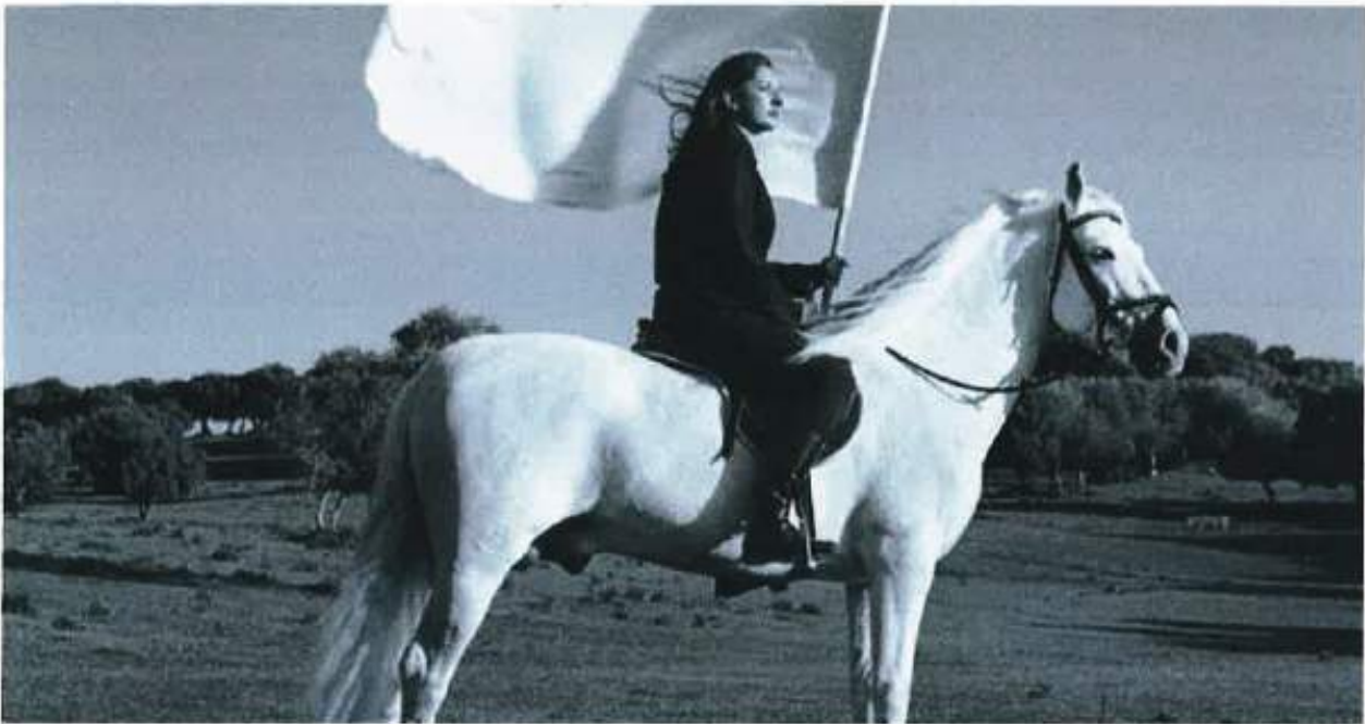
Marina Abramovic. 'El héroe II' (2008). Cortesía y Colección Ars Futura-Serge Le Borgne, París (Francia). © Marina Abramovic / VEGAP 2011, Madrid.