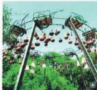
Una obra, en la Fundación Montenmedio Arte Contemporáneo.